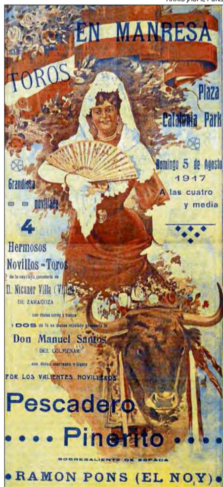
Corrida de toros a Manresa l'any 1917